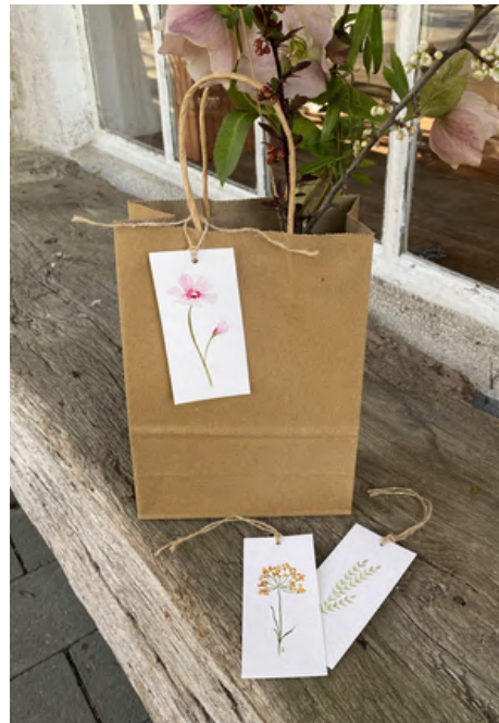
Kleine Botschaften - liebevolle Geschenkanhänger mit Aquarellblüten