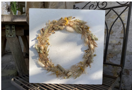
Naturkunst - floraler Kranz auf Pappwabenplatte