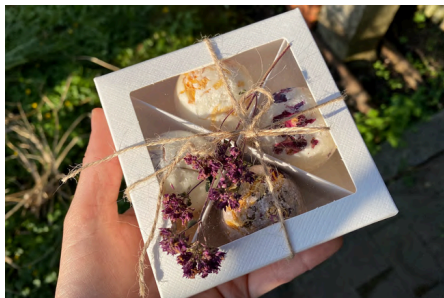
Loslassen, entspannen, genießen mit den Badekugeln von Florex

Unser kleiner Hofladen im alten Pferdestall ist für uns ein ganz besonderer Ort. Es ist ein Raum der Kreativität und Inspiration, in dem die Liebe zur Natur und Schönheit des Lebens spürbar wird. Bewusst und mit feinem Gespür gestalten wir unsere Werkstücke, mit dem notwendigen Maß an Aufmerksamkeit und Wertschätzung. Du findest bei uns handgefertigte Unikate aus Stoff, Papier, Natur und Garten sowie ausgewählte hochwertige Produkte, die deinen Körper, deine Sinne und deine Seele berühren.